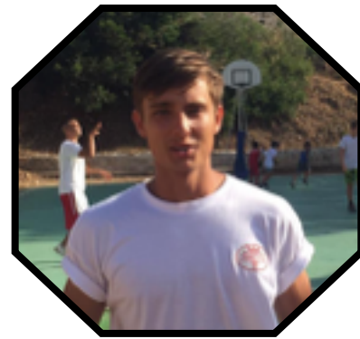
Victoire probante des U20M ! Page 6

Week end de reprise pour les jeunes ! Les U11 remportent leur tout premier match !